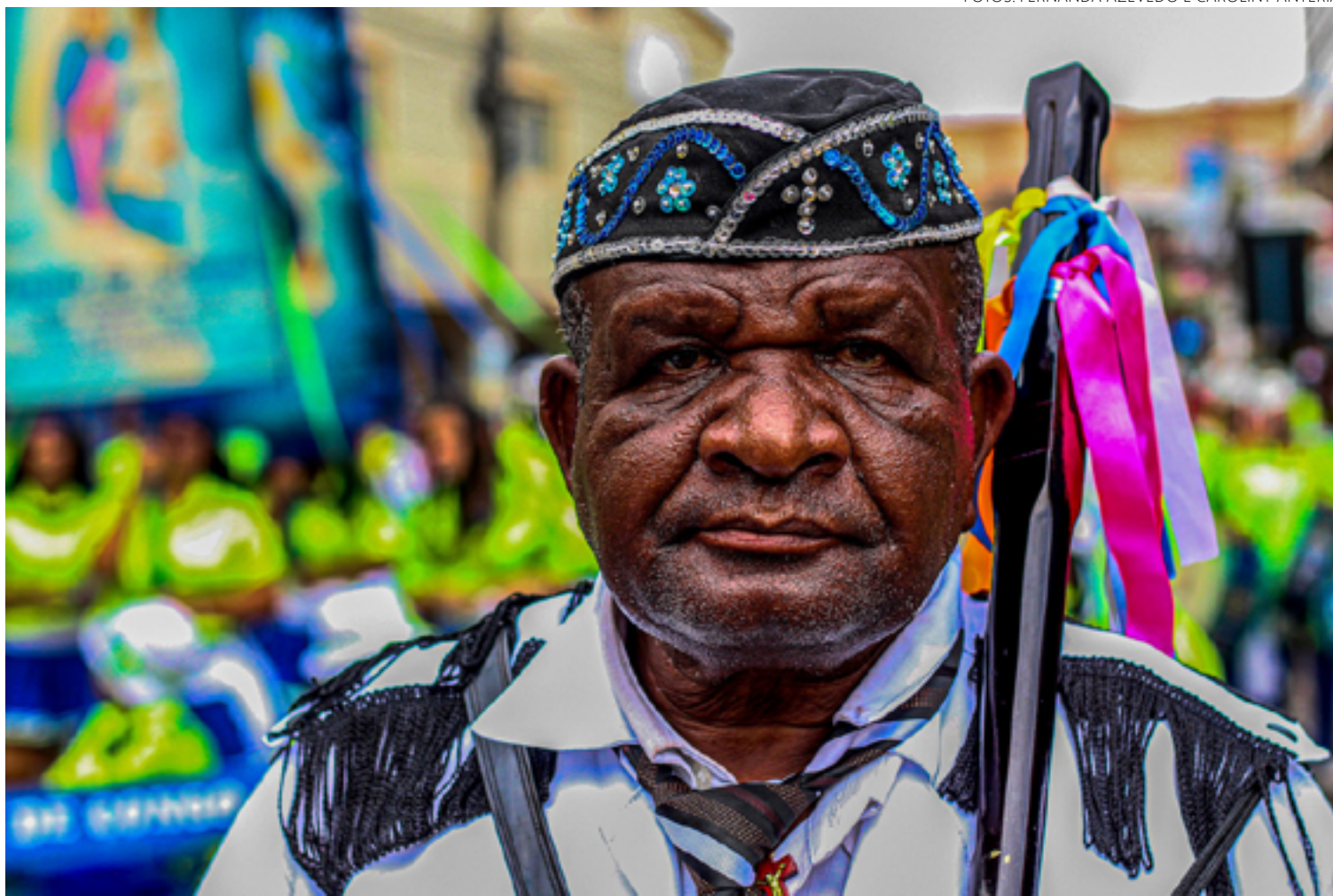
Congadas são festas de matriz africana: patrimônio cultural celebrado pela função documental da arte