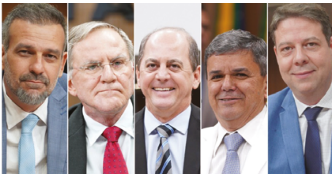
A Assembleia retomou as votações nesta terça-feira, 8, em sessão marcada por comentários sobre o pleito