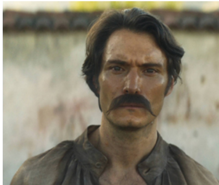
'Cem Anos de Solidão' se baseia em livro de Gabriel García Márquez