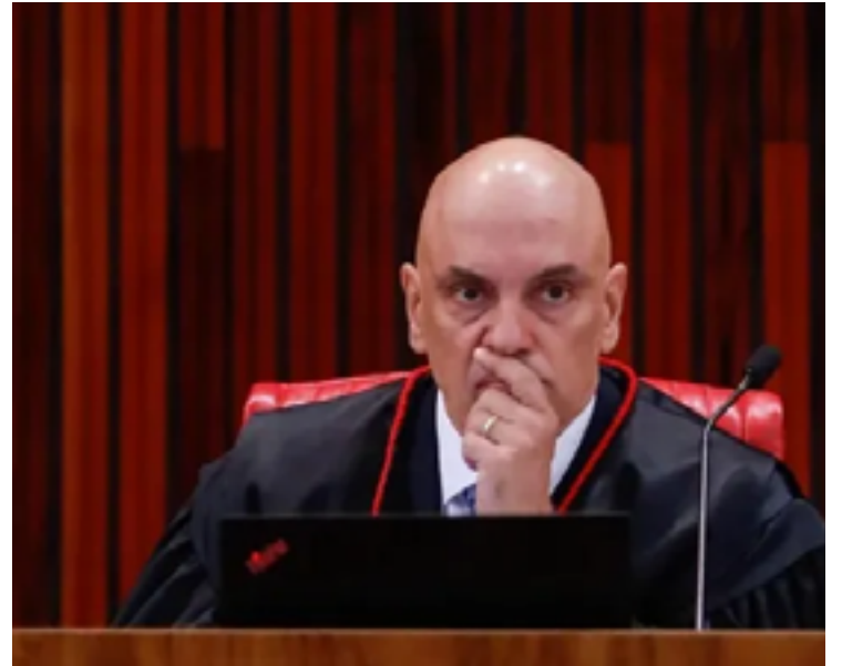
Decisão foi tomada após a plataforma, de propriedade de Elon Musk, cumprir todas as exigências impostas pelo STF

A Agência Nacional de Telecomunicações (Anatel) ainda aguarda a notificação oficial para realizar o procedimento técnico de desbloqueio da plataforma. O processo não ocorre automaticamente e depende dessa confirmação para que o serviço volte ao funcionamento normal no país.