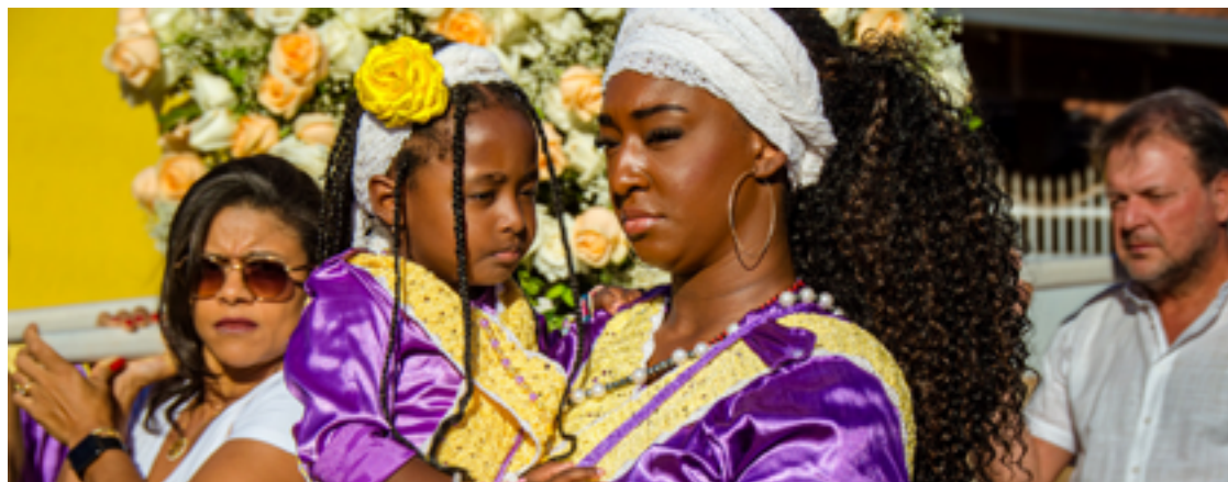
Imagens trazem à tona colorido, movimento e fé dos congadeiros: evento popular fica exposto ao público

ção é um pedaço da história das famílias e comunidades que mantêm essa tradição viva", afirma o curador.