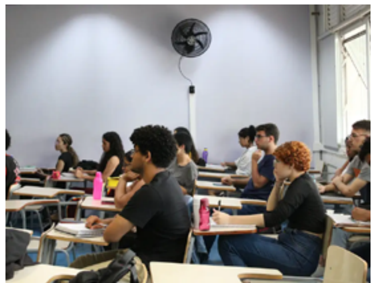
Prazos não se aplicam aos candidatos do bloco 4, que ainda não tiveram notas divulgadas devido a decisão judicial

O MGI esclareceu ainda que a comprovação de títulos é apenas classificatória; portanto, a classificação do candidato pode mudar de acordo com a pontuação obtida na etapa. Os candidatos que não enviarem a documentação dentro deste prazo receberão nota zero nesta avaliação. Entretanto, a ausência de títulos não implicará na desclassificação do candidato, que manterá a pontuação obtida nas etapas anteriores do certame.