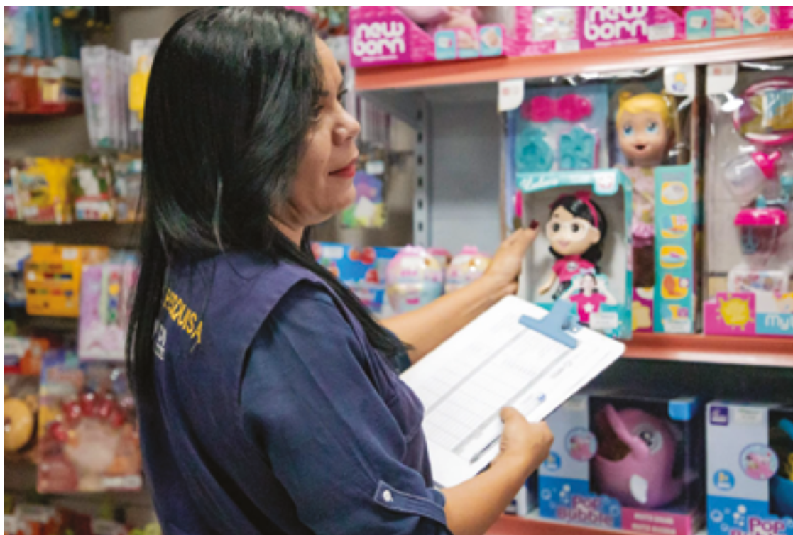
Produtos tiveram valores comparados com mesmas características e pesos, e critério de “menor preço”

A boneca Disney Princess básica lidera a variação de preços, com uma diferença de 117%. O consumidor encontra o produto por valores que vão de R$ 59,90 (preço mais baixo) a R$ 129,99 (preço mais alto). Com uma flutuação de 100%,