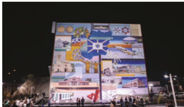
Painel terá proteção e fica proibida alienação, destruição e modificação

“Trata-se de um marco artístico de grande relevância,