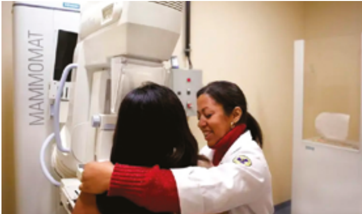
Ideia é conscientizar mulheres sobre importância do diagnóstico precoce

Previsão é realizar 40 exames por dia em cada uma das seis unidades do Governo de Goiás em outubro