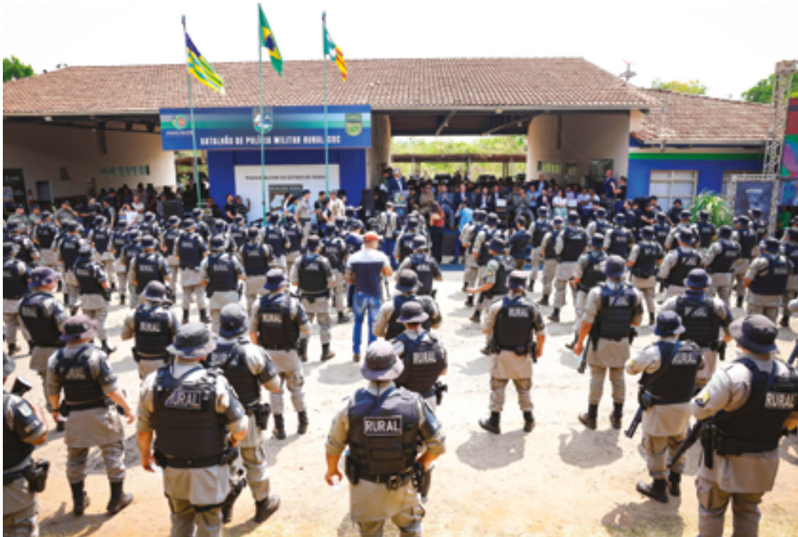
Ronaldo Caiado garantiu continuidade de investimentos para manter Goiás como “estado mais seguro do Brasil”

“Esse batalhão é uma realidade em Goiás. Conta com uma grande estrutura e atua com força nos 246 municípios do estado. Hoje, é a unidade que mais entra com viaturas, com cerca de 100 em serviço