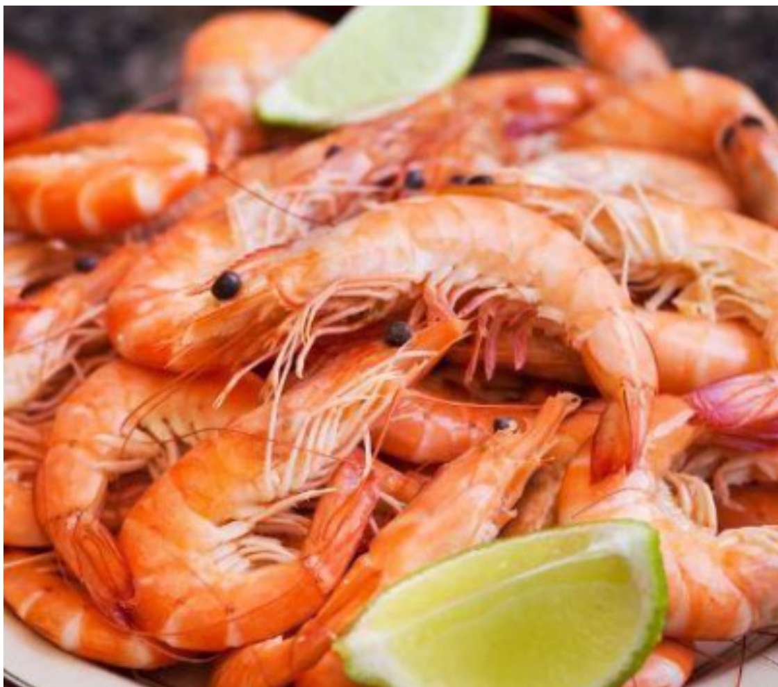
Lagosta: alimento exige habilidade e, neste caso, usar as mãos é aceitável

Comer alimentos mais sofisticados é uma habilidade que pode ser desenvolvida com conhecimento e prática. Alimentos difíceis podem ser desafios, mas com algumas dicas de etiqueta e prática, você pode desfrutar de qualquer refeição com confiança. Algumas orientações sobre como lidar com certos alimentos mais complicados de maneira adequada. Seguindo essas dicas de etiqueta e com um pouco de paciência você poderá desfrutar de refeição com segurança e elegância.