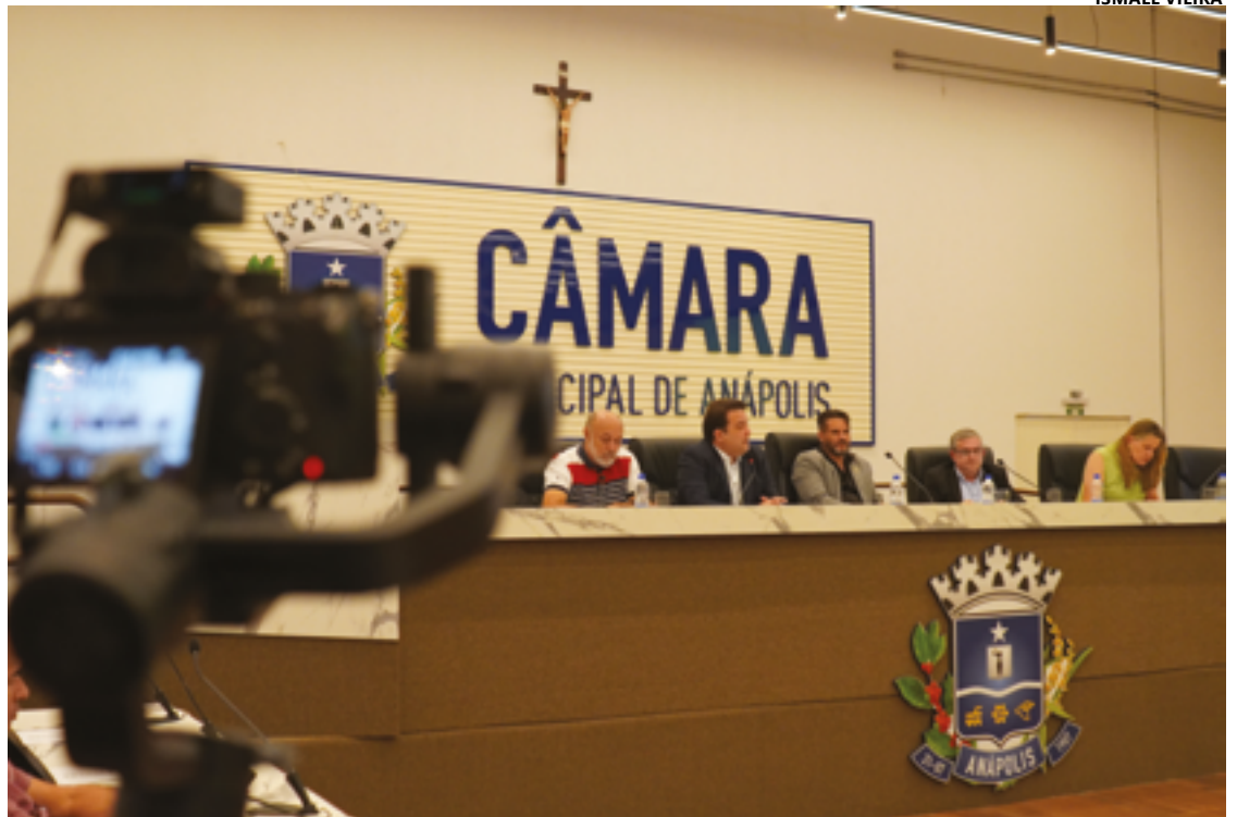
Os dados do relatório fiscal mostram um crescimento de 10,32% na receita tributária entre os dois quadrimestres

“Não teve um canto de Anápolis deixado de lado”, disse o prefei-