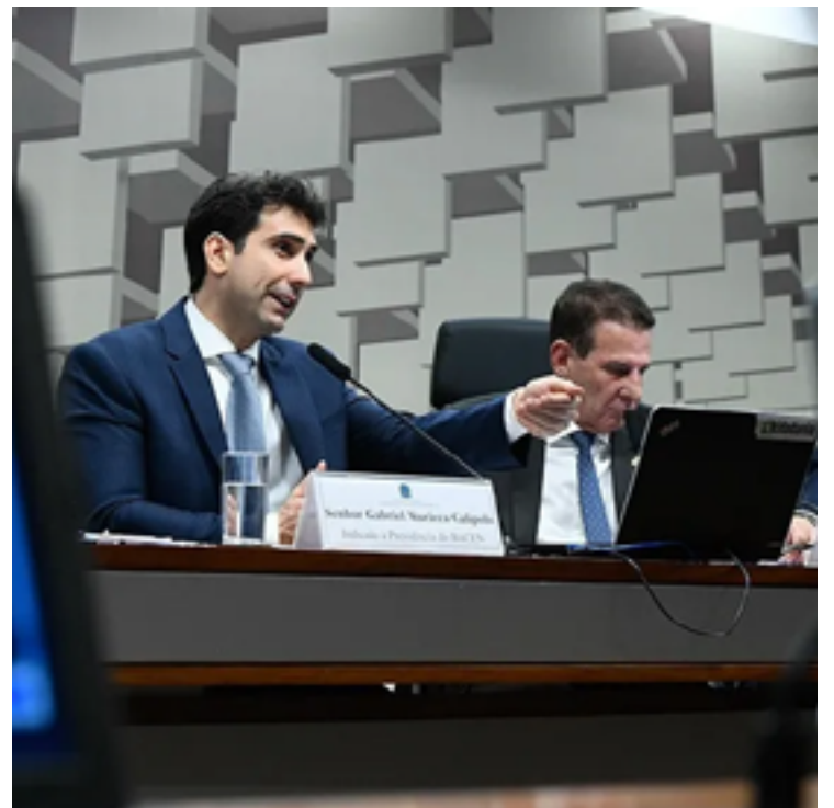
Economista assumirá o cargo em janeiro de 2025, sucedendo Roberto Campos Neto

Além disso, o economista destacou a importância de manter a autonomia do Banco Central para cumprir suas funções de maneira eficiente. “A estrutura institucional do Banco Central deve permitir que ele desempenhe plenamente suas funções, sem interferências externas”, declarou.