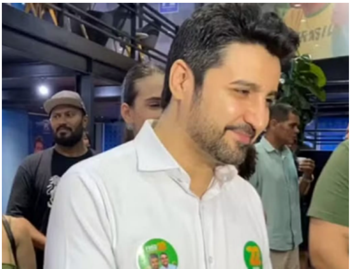
Fred Rodrigues: apoio das forças de direita

Ele iniciou a atuação política em 2018, quando se candidatou a vereador por Goiânia, mas não foi eleito. Em 2022, ele foi eleito deputado estadual. No entanto, em dezembro de 2023, o Tribunal Superior Eleitoral (TSE) cassou o registro de candidatura dele devido a supostas irregularidades na prestação de contas das eleições de 2020, quando ele concorreu a vereador em Goiânia.